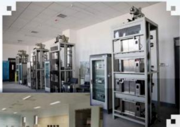
智能电梯安装调试 维护训练场所